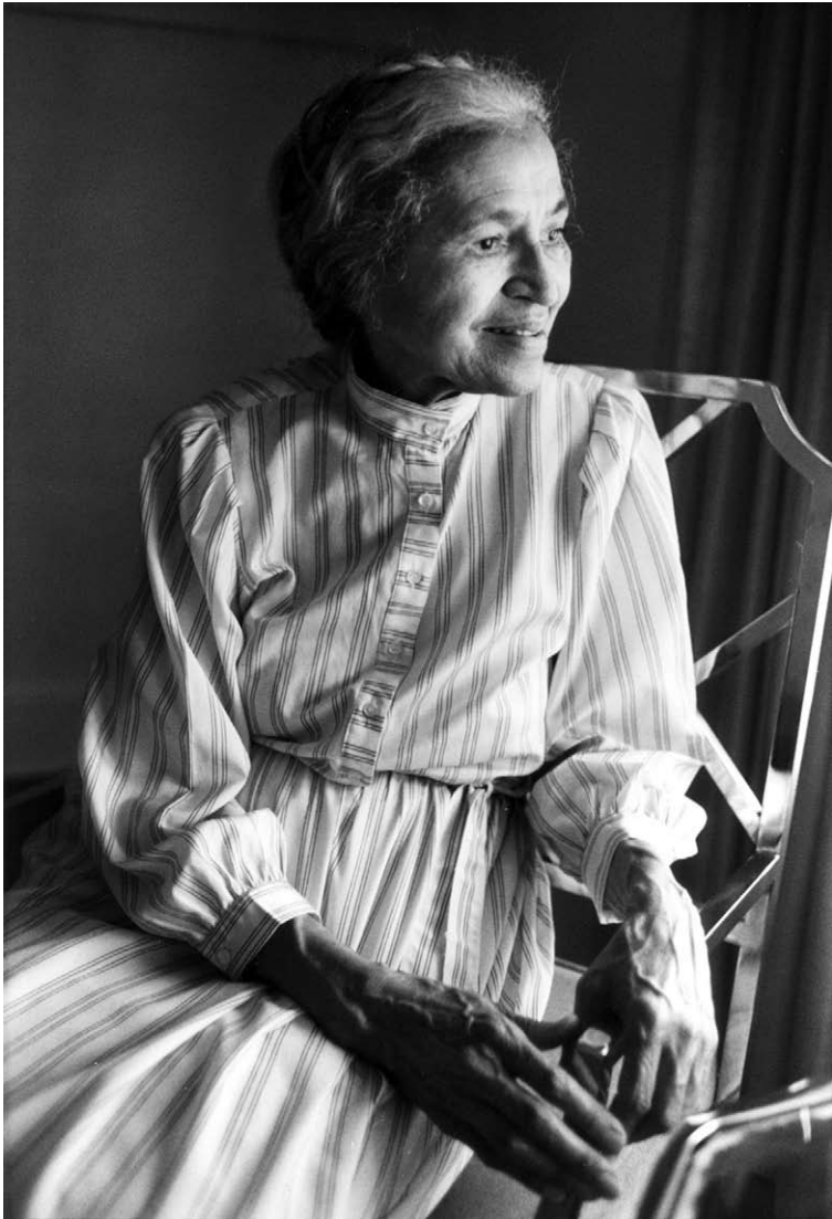
Rosa Parks als ältere Frau